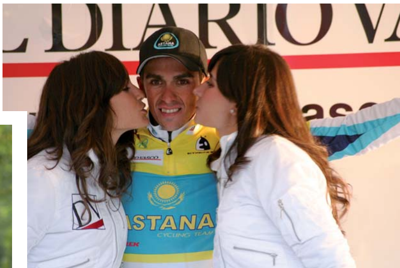
In alto: Alberto Contador, fresco vincitore della Vuelta in Spagna; a sinistra: Alexander Vinokourov, ex bandiera della squadra di Astana.

France, Parigi-Nizza, Tour del Qatar e Parigi-Dakar, annuncia che l'Astana Team non potrà partecipare al Tour de France 2008 e che il suo capitano Contador non potrà difendere il titolo.